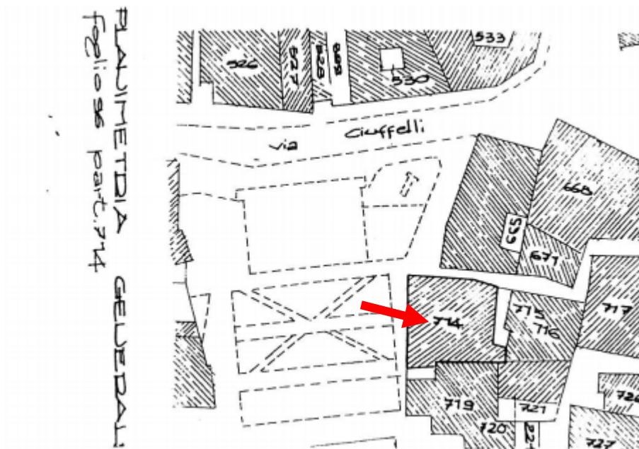
Mappa catastale fuori scala

La Consolazione ETAB (Ente Tuderte di Assistenza e Beneficenza), è proprietario tra l'altro di una unità immobiliare sita in Todi, Piazza Umberto I, 6 piano secondo censita al CF al foglio 96, p.lla 714 sub 13, cat. A/2, classe 5, consistenza 6 vani, rendita catastale € 666,23; detto immobile risulta vincolato ai sensi dell'art. 10 del D.lgs 42/2004 e ss.mm.ii. L'unità immobiliare è parte del complesso urbano noto come "Palazzo Vecchi Ercolani" ed è posto nelle immediate vicinanze del magnifico Tempio di San Fortunato dove riposano i resti del Beato Jacopone da Todi. Dai locali oggetto di avviso si gode di una vista suggestiva sulla scalinata di San Fortunato.