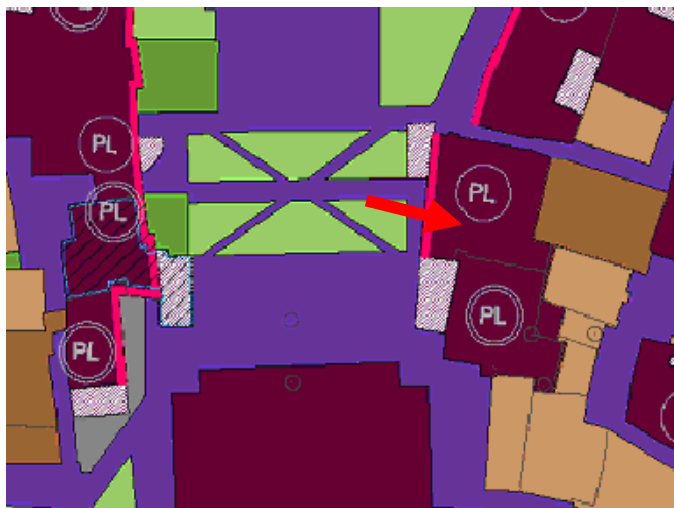
Estratto PRG (stralcio fuori scala)