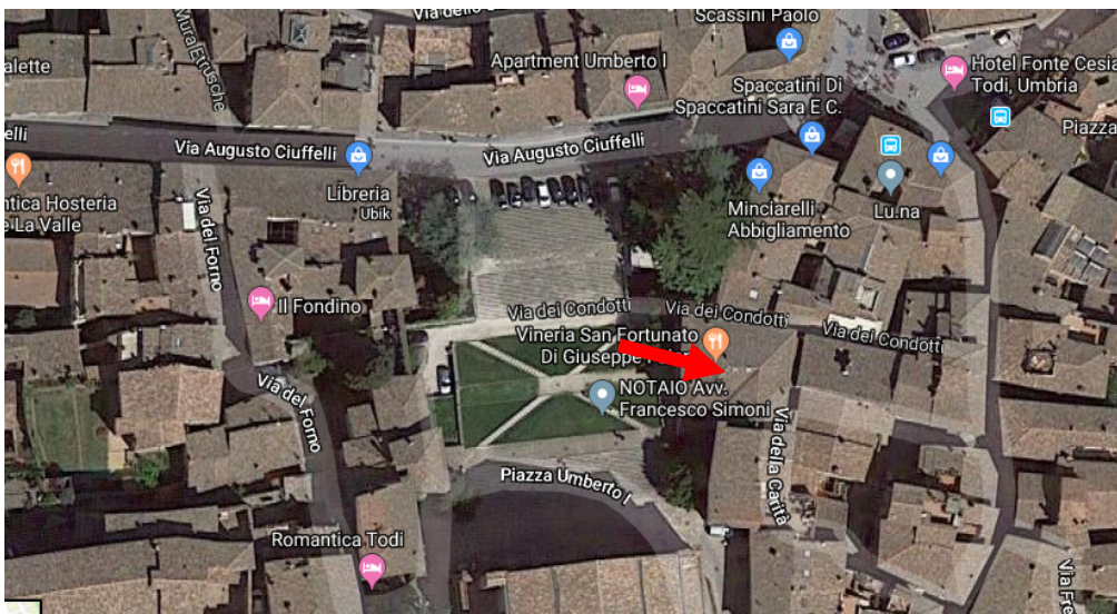
Foto aerea fuori scala